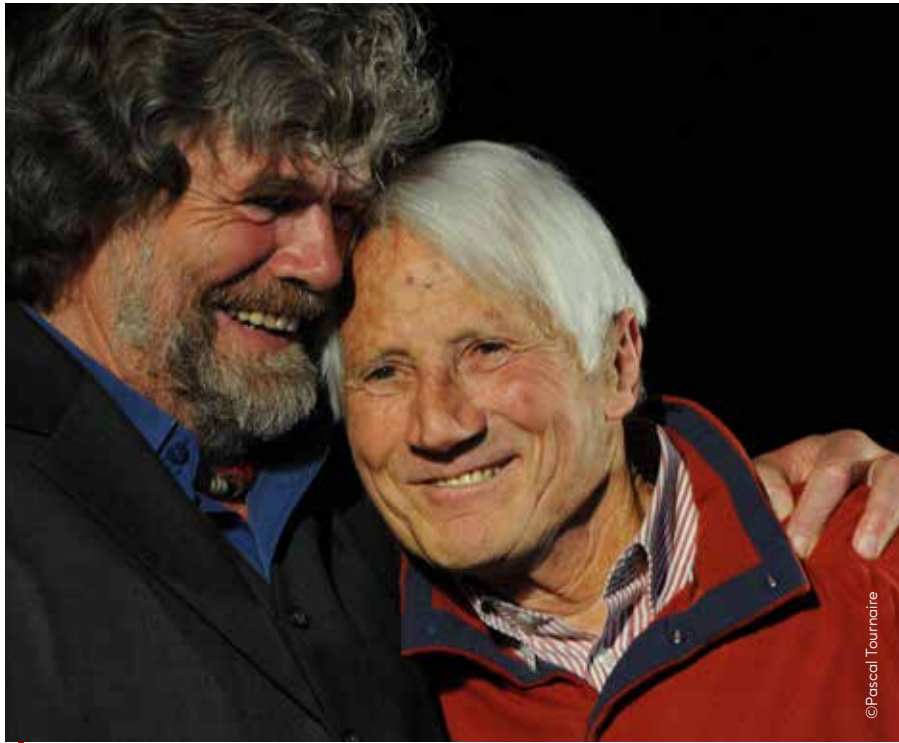
Reinhold Messner et Walter Bonatti, deux des plus grands alpinistes du monde, lors de la cérémonie des Piolets d'or à Chamonix et Courmayeur en 2010.