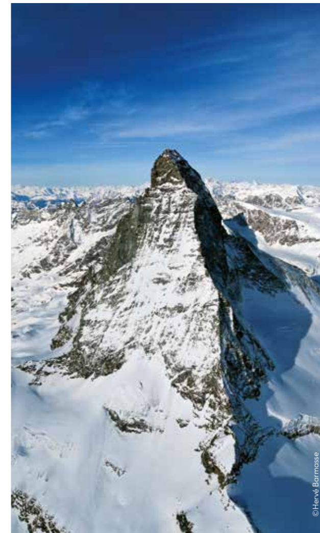
Le Cervin, côté suisse. Un élan, une forme inimitables, une histoire qui imprègne la saga de l'alpinisme...

Conrad Gessner, il y a quatre cents ans, donnait déjà une parfaite définition de l'alpinisme.