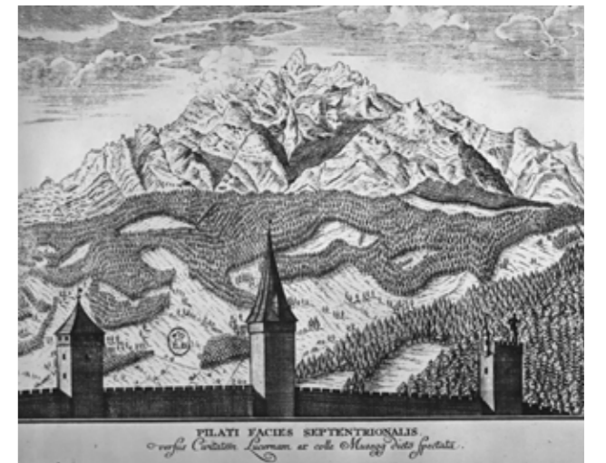
Une gravure ancienne montrant le mont Pilatus, tel que Conrad Gessner a pu le contempler.