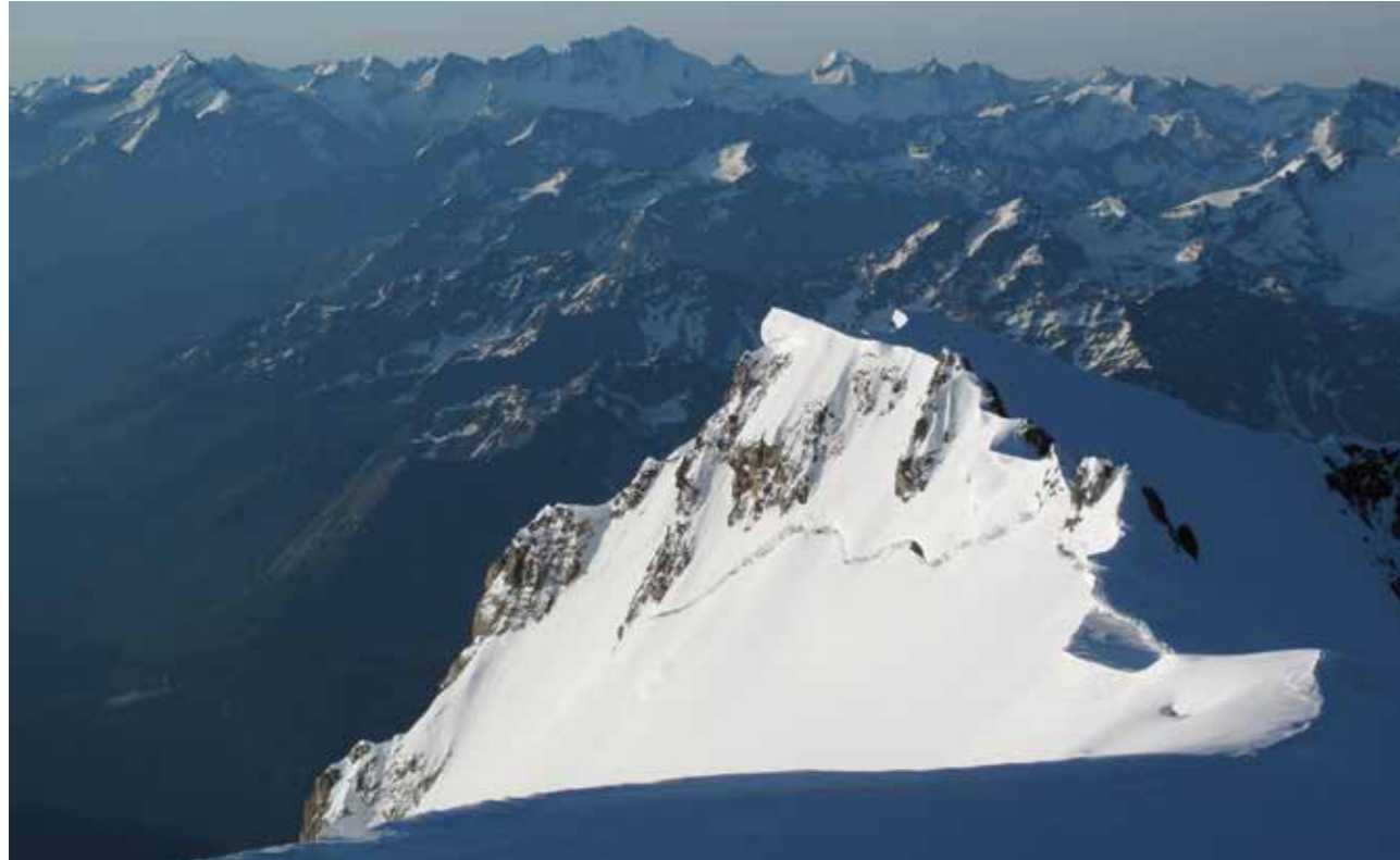
Du sommet du mont Blanc, le mont Blanc de Courmayeur et le massif du Grand Paradis.

Une activité candidate à l'inscription au PCI de l'UNESCO doit faire état de ses racines. L'alpinisme a été pratiqué à des époques différentes, dans des lieux différents. Le massif du Mont-Blanc est l'un de ceux-ci. La première ascension du point culminant des Alpes, en 1786, par deux Chamoniards, a lancé une mode, soutenue par la publication des écrits d'Horace-Bénédict de Saussure, naturaliste genevois, sponsor de l'expédition et auteur de la troisième ascension en 1787. La candidature au PCI est partie des vallées du Mont-Blanc, massif qui reste un des plus fréquentés par les alpinistes. Les Alpes jouent, depuis plus de deux cents ans, un rôle central dans la pratique et l'évolution de l'alpinisme.