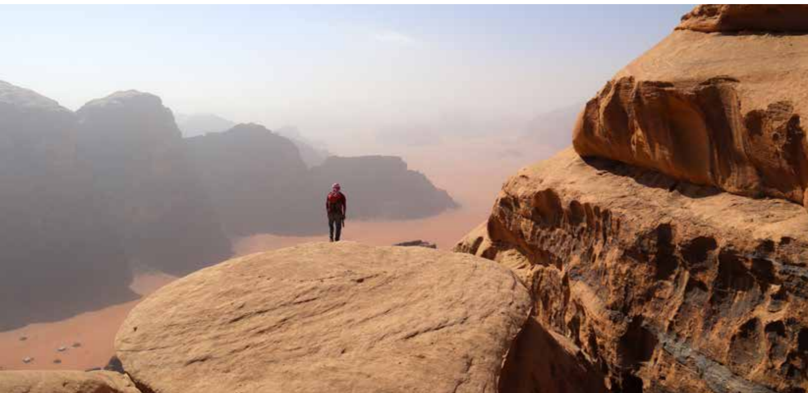
Sous le sommet du Jbel Rum, un alpinisme aventureux et exotique au-dessus du désert de Wadi Rum.

Poussés par le besoin de nouveaux horizons et d'altitudes plus extrêmes, les alpinistes ont voyagé. L'Alaska, les Andes, l'Antarctique, l'Himalaya, le Sahara leur ont offert leur splendeur. Ils y ont goûté la solitude, l'engagement, ils sont aussi allés à la rencontre des autres, les habitants des hautes vallées.