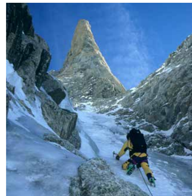
Une goulotte au mont Blanc du Tacul, archétype des nouvelles ascensions glaciaires à partir de 1971.